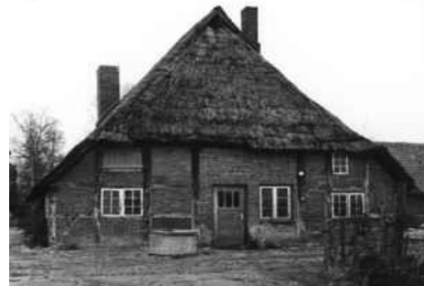
C1. Haus Klumpen, Krummesse, Lübnitzfeld Landgut

Das Gerüst wird unvollständig weitergegeben, wie beim Abbau geborgen. VB 5.000 €